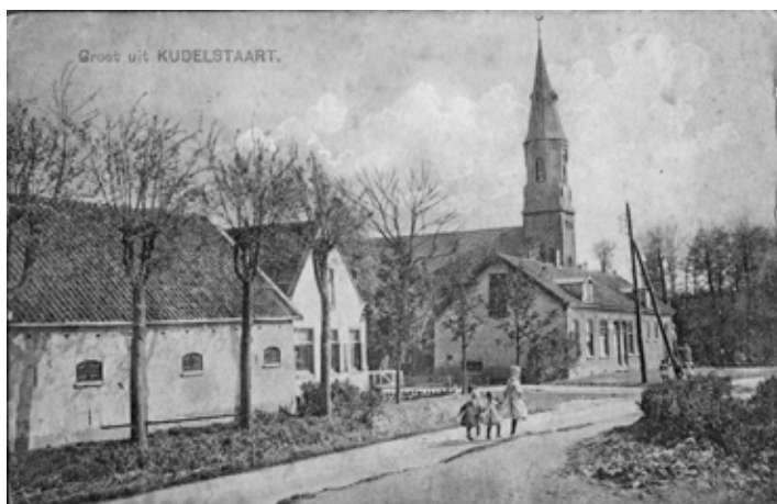
'Ik ben geboren in het huis naast de kerk.' Rechts op de foto de kruidenierszaak annex café van Gerrit Buskermolen.